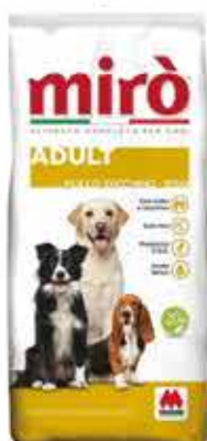
ADULT POLLO-TACCHINO KG. 20 - € 25,90