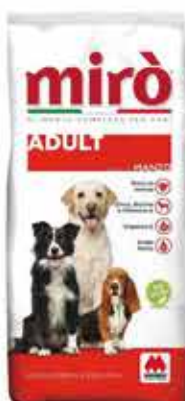
ADULT MANZO KG. 10 - € 13,90 ADULT MANZO KG. 20 - € 24,90