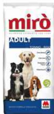
ADULT TONNO-RISO KG. 20 - € 28,90