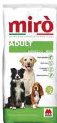
ADULT AGNELLO-RISO KG. 20 - € 34,90

Vasta gamma di prodotti e accessori, anche per diete