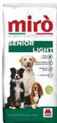
ADULT SENIOR-LIGHT KG. 20 - € 34,90