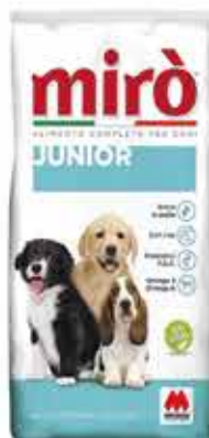
JUNIOR KG. 4 - € 11,50