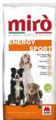
ADULT ENERGY-SPORT KG. 20 - € 32,90