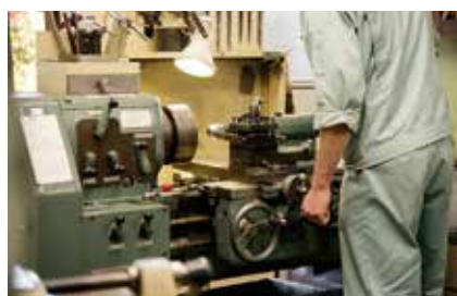
medie imprese lombarde del settore commercio, terziario, manifatturiero

se e partite IVA, acquistare beni strumentali, software e hardware, coprire canoni di locazione e coprire le spese generali e di comunicazione. Il contributo a fondo perduto è del 50% delle spese ammissibili, sino a un massimo di 10.000 euro, per spese sostenute a partire dal 1° gennaio 2022. I beneficiari di questa nuova edizione sono: lavoratori autonomi con partita Iva individuale e micro, piccole e