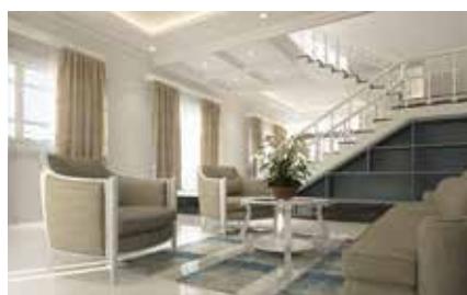
Sono risultati in crescita i prezzi del mercato immobiliare nell'area metro-

G li immobili a Milano, a fine 2021 valgono 5.898 euro al mq, +1,1% in sei mesi, +13,2% in due anni, ma ci sono preoccupazioni per gli operatori da inizio anno: rallentamento delle trattative, emergente incertezza per la finanziabilità delle operazioni, influsso della situazione internazionale, lievitazione dei costi di materie prime e energia, perdita di clienti russi e ucraini.