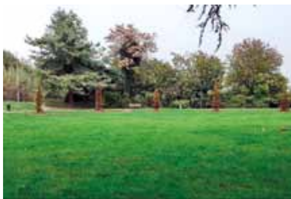
Vettabbia, Via Bezzecca, Parco di Civesio e alcuni istituti scolastici del territorio.

Le zone interessate dall'intervento sono Parco Nord, Via Cattaneo, Via Repubblica, Parco della